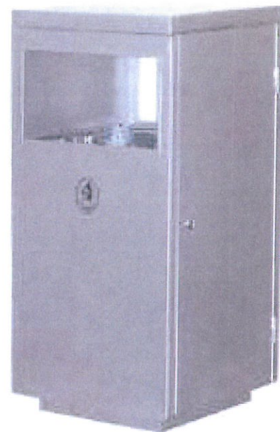
KOSZ NA ODPADY Z SEGREGACJĄ- 6 szt.