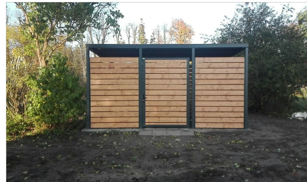
ZDJĘCIE ANALOGICZNEJ WIATY ŚMIENIKOWEJ

KOLOR KONSTRUKCJI STALOWEJ: GRAFITOWY KOLOR WYPEŁNIENIA DREWNIANEGO: DREWNIANY/BRAZ DESKI WYHEBLOWANE, ZAIMPREGNOWANE KONSTRUKCJA STALOWA OCYNKOWANA I MALOWANA PROSZKOWO DRZWI WYPOSAŻONE W ODBOJNIK STALOWY WIATA WYPOSAŻONA W OŚWIETLENIE LED10W ZASILANE Z BATERII