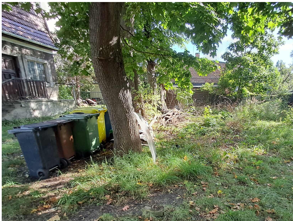
Fot.3 Lokalizacja projektowanej wiaty śmietnikowej.