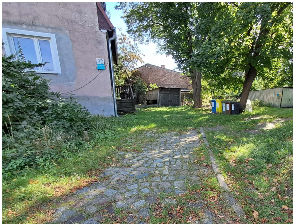
Fot.1 Widok na istniejące zagospodarowanie terenu

Istniejąca nawierzchnia z rzędowej kostki granitowej po pozostawienia.