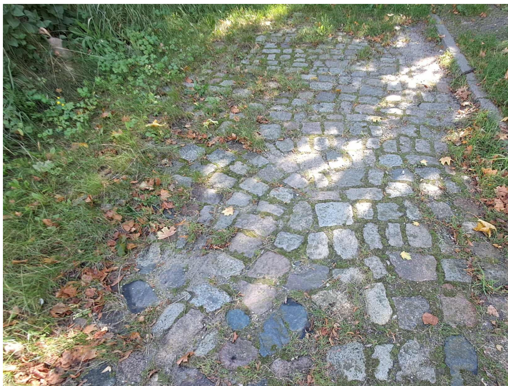
Fot.2 Istniejąca nawierzchnia drogi dojazdowej – do pozostawienia.