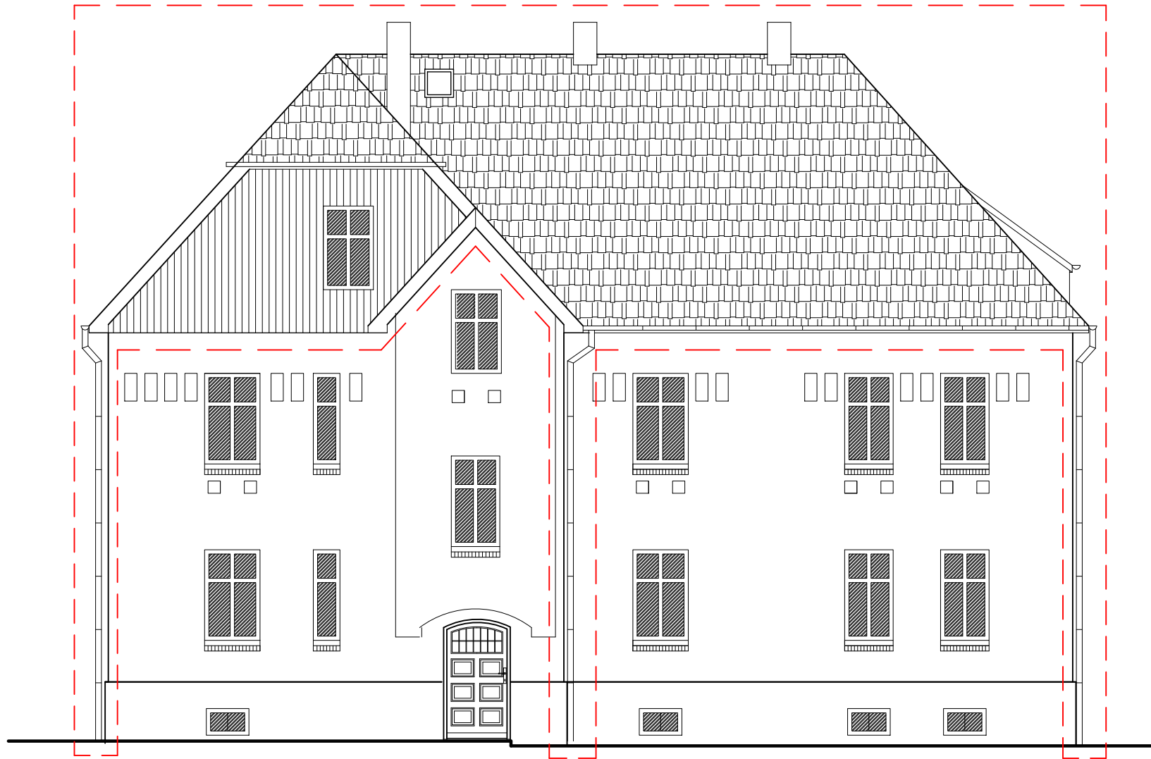
ELEWACJA PÓŁNOCNO - ZACHODNIA