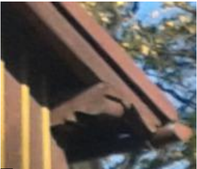
B ZAKOŃCZENIE KROKWI I MURLATY