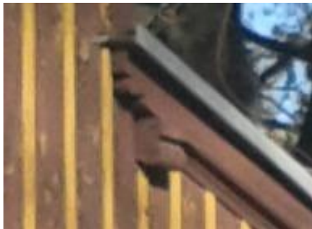
E ZAKOŃCZENIE KROKWI I MURLATY