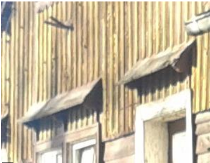
C ZADASZENIA NAD OKNAМИ - PRZYZIEMIE