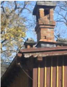
B ZAKOŃCZENIE KROKWI I MURLATY