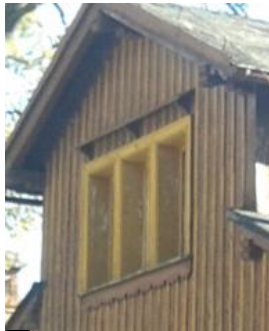
D ZADASZENIA NAD OKNAМИ - PIĘTRO ZDOBIENIA PODPARAPETOWE