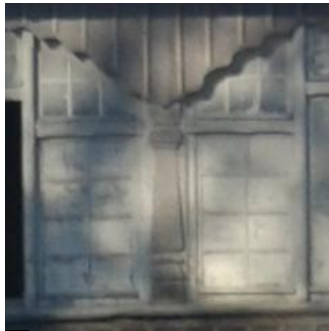
A ELEMENTY ZDOBIEN MIEDZYOKIENNYCH

ISTNIEJĄCE ELEMENTY DEKORACYJNE DO ZACHOWANIA POPRZECZ RENOWACJĘ LUB EWENTUALNE ODTWORZENIA