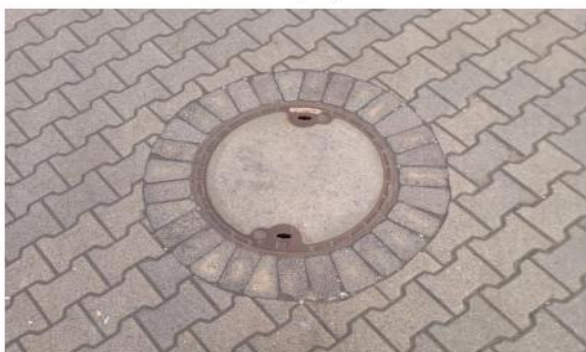
fot. obróbka armatury wodociągowej