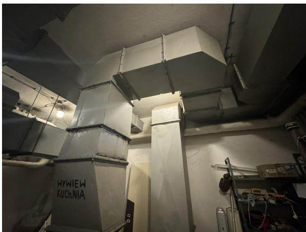
Zdjęcie istniejącego kanały wentylacji mechanicznej

Zakres naprawy istniejącej wentylacji polega na wymianie turbiny, która nie działa.