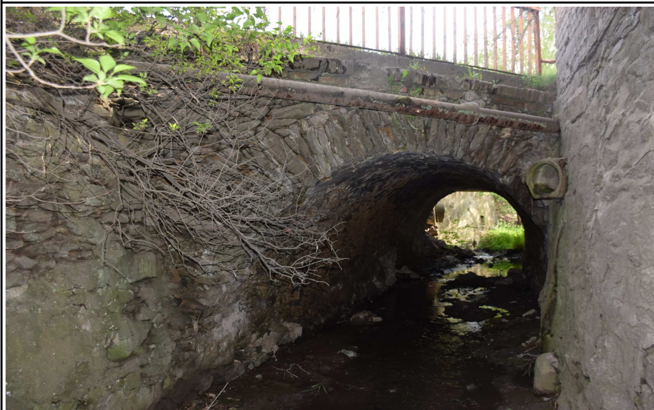
Fot. 2. Widok z boku od strony dolnej wody.