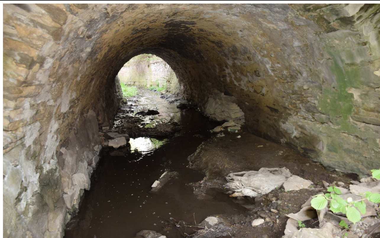
Fot. 8. Zanieczyszczenia przestrzeni podmostowej.