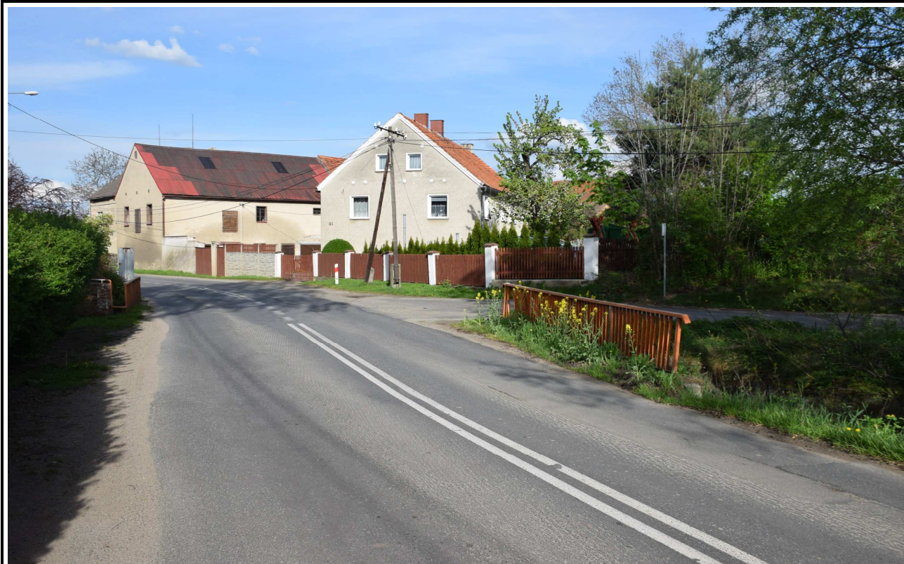
Fot. 1. Widok z góry.