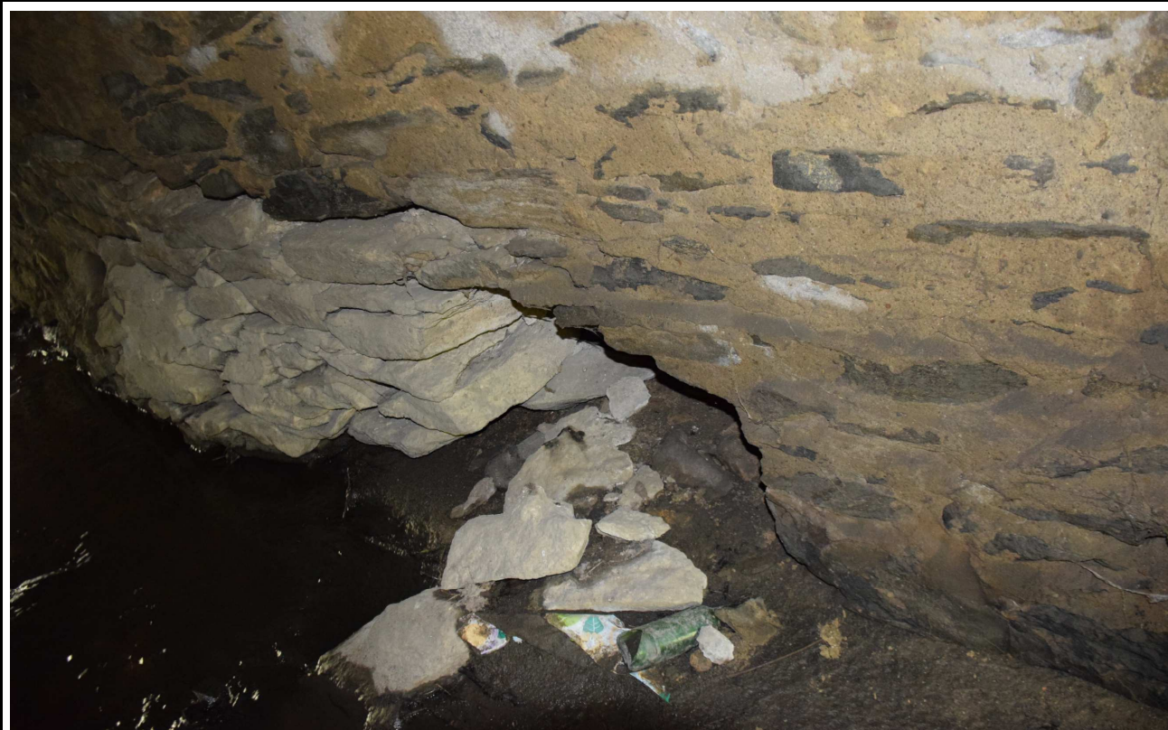
Fot. 10. Ubytki i przemieszczenia kamieni przyczółka.