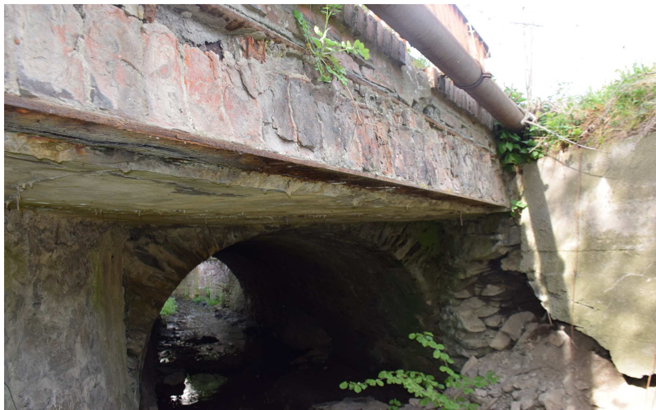
Fot. 7. Korozja i ubytki cegieł gzymsu.