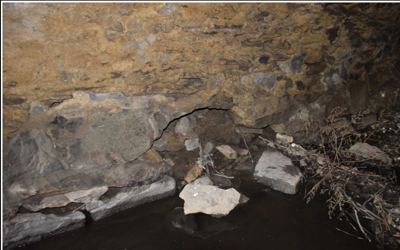
Fot. 9. Ubytki i przemieszczenia kamieni przyczółka.