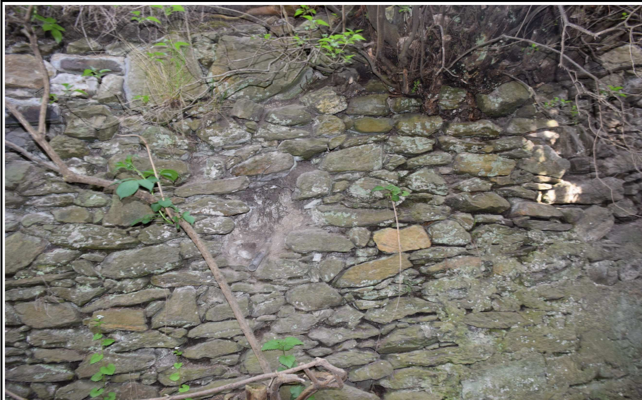
Fot. 11. Ubytek spoin kamieni ściany oporowej.