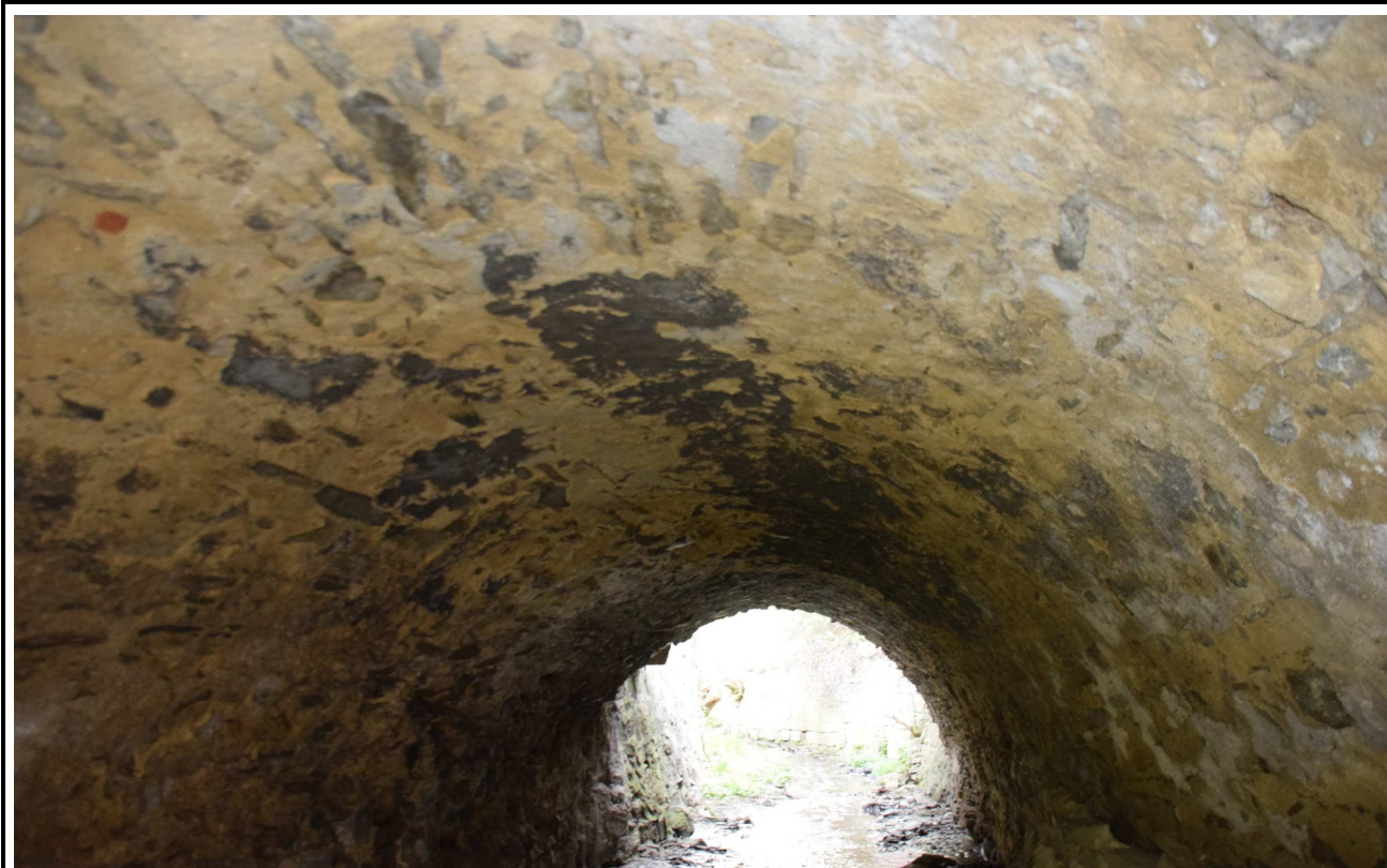
Fot. 4. Widok od spodu.