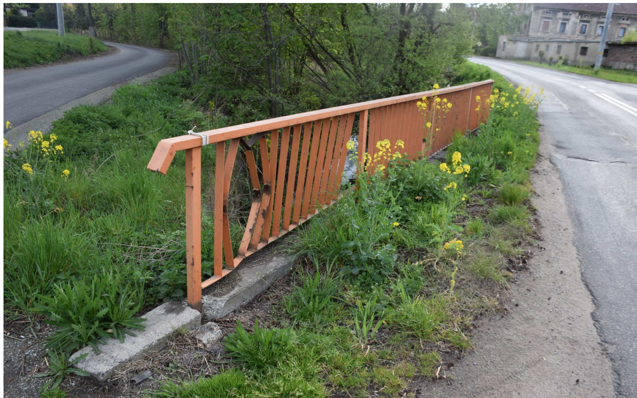
Fot. 5. Korozja i deformacje elementów balustrady oraz wegetacja roślinności wzdłuż krawędzi jezdni.