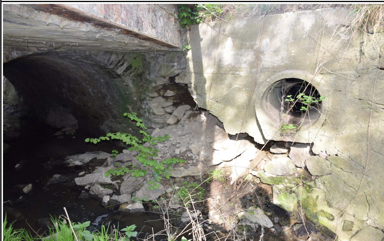
Fot. 6. Ubytki i przemieszczenia kamieni ściany oporowej.