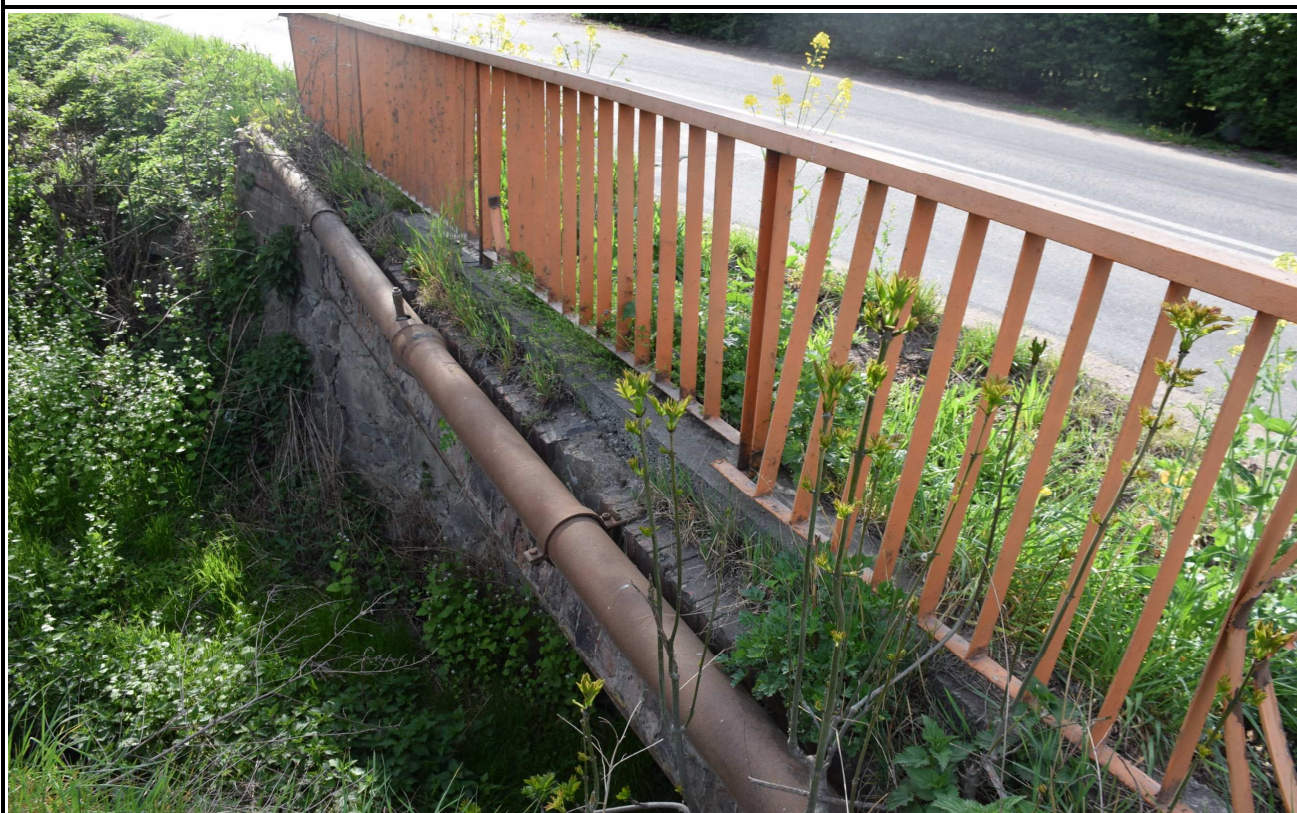
Fot. 12. Korozja rury osłonowej urządzeń obcych.