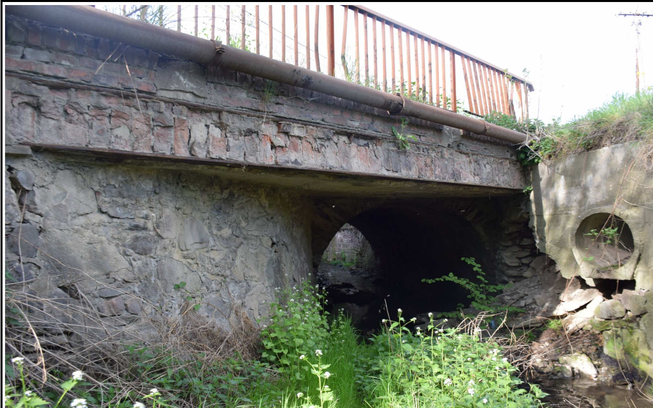
Fot. 3. Widok z boku od strony górnej wody.