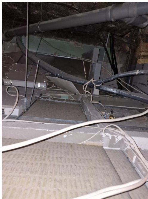
Fot. nr 1 i 2- Widok przestrzeni i ponad stropem

kasetonowym nad istniejącymi sanitariatami