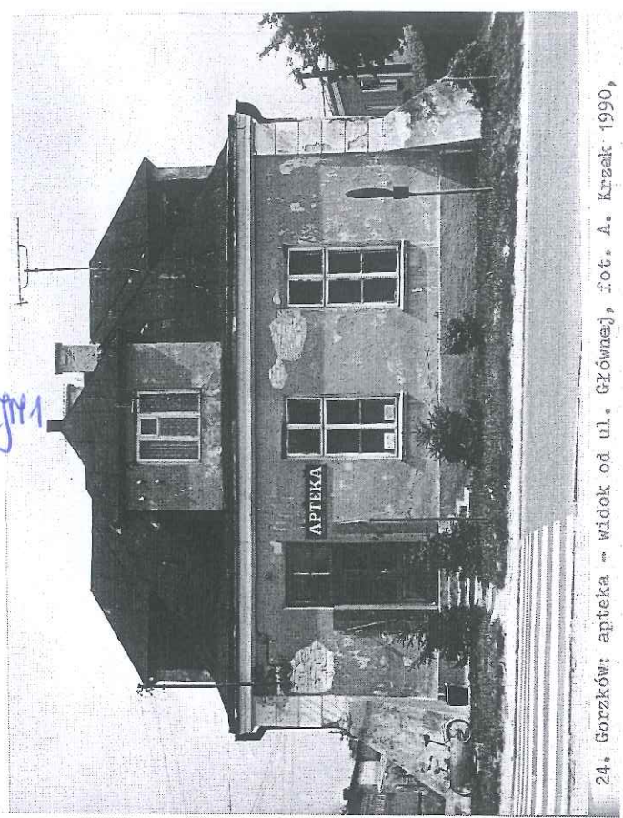
24. Gorzków: apteka - widok od ul. Główniej, fot. A. Krzak 1990.

Z up. Lubelskiego Wojewódzkiego Konserwatora Zabytków mgr Paweł Wira Kierownik Delegatury w Chełmie