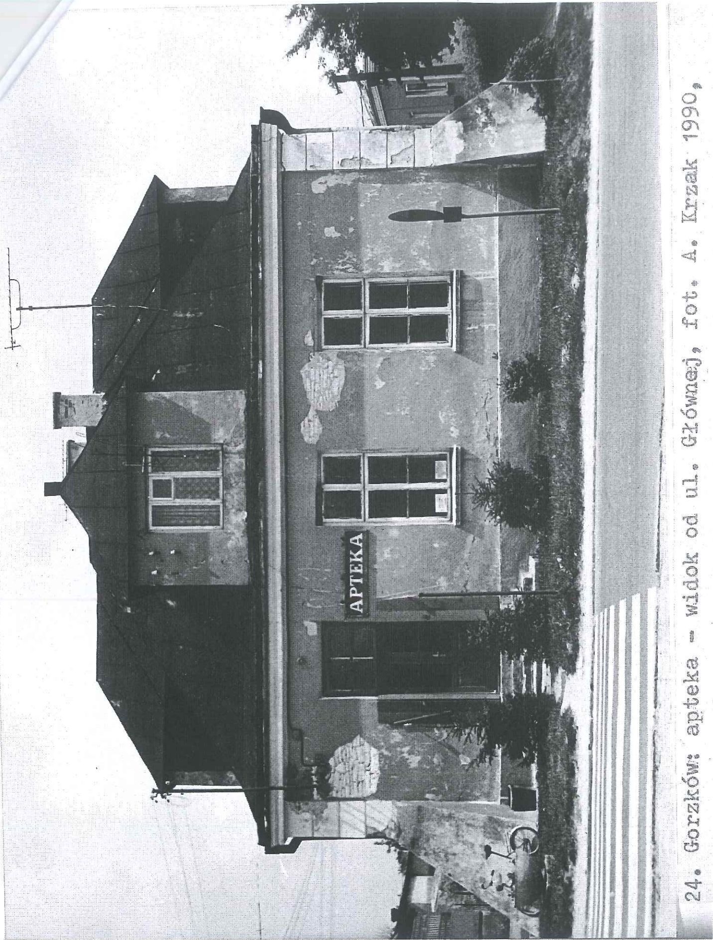
24. Gorzków: apteka - widok od ul. Głównej, fot. A. Krzak 1990,